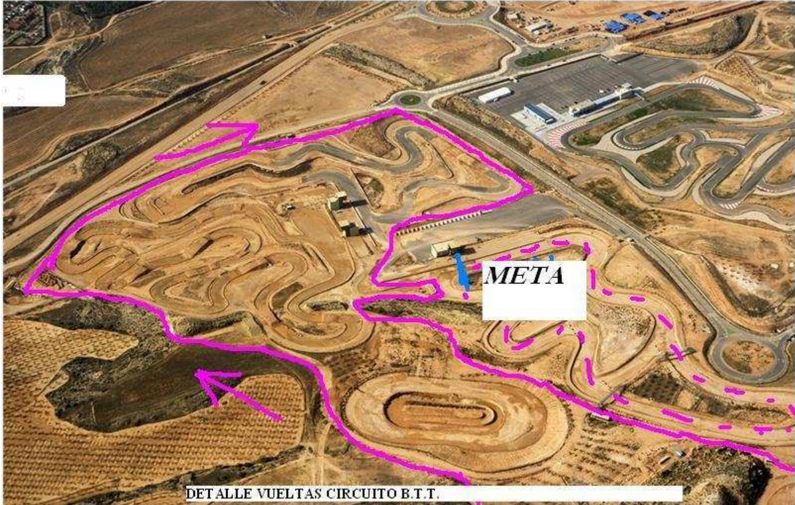
DETALLE VUELTAS CIRCUITO B.T.T.