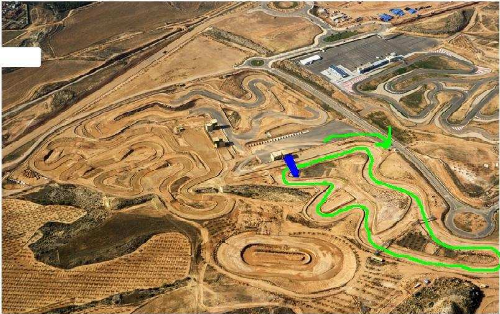
SECTOR 3 (2 VUELTAS DE 1'1 KMS.)