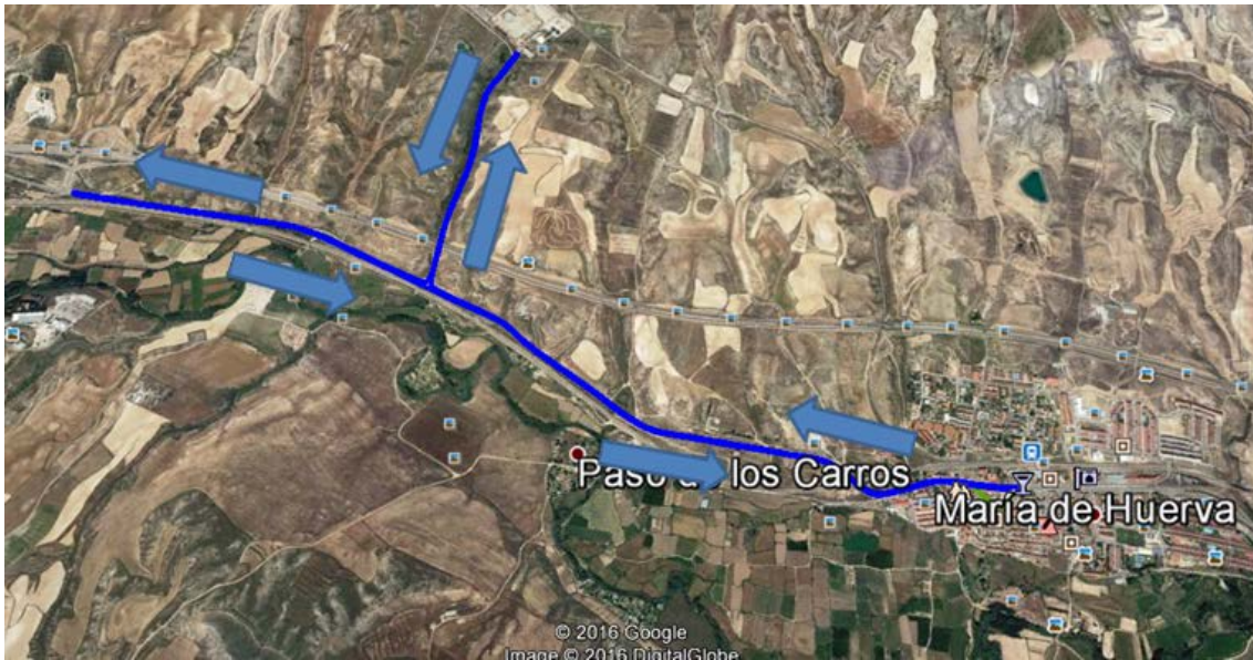
Circuito de bici (2 vueltas), por carretera N-330 dirección Muel

de banderolas de señalización. También se situarán voluntarios en los cruces de caminos que se incorporan al tramo de vía del circuito con su debida señalización. Completadas las 2 vueltas del circuito se terminará el segmento ciclista en la T2.