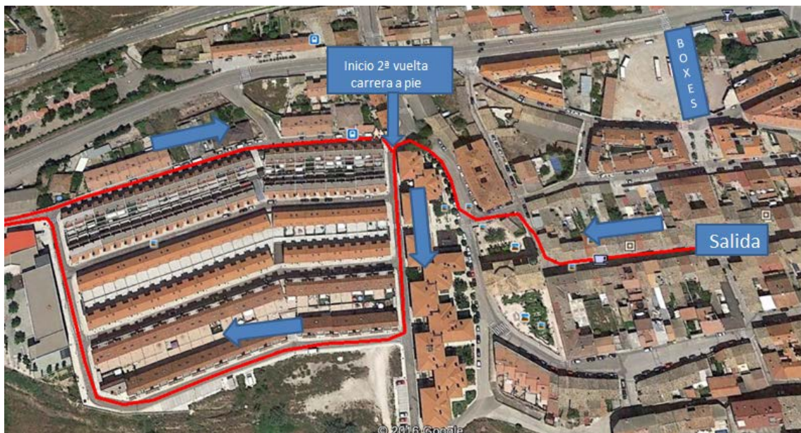
Detalle de la salida y punto de inicio de segunda vuelta.