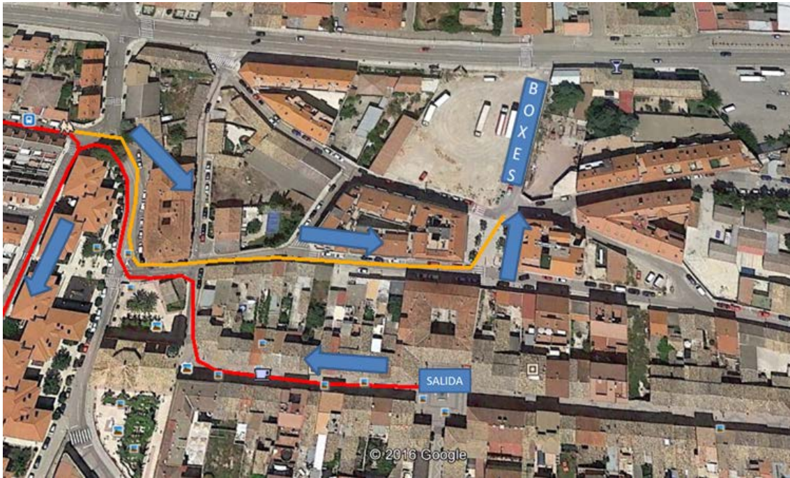
Detalle del enlace a la T1.

Área de transición de carrera a pie a ciclismo (T1): Los duatletas deberán abandonar el circuito de carrera a pie (tras la segunda vuelta) para dirigirse a la T1 por la calle de la Jota, girando a la izquierda por la plaza Luis Buñuel y así dirigirse a la calle Agustina de Aragón, donde estará ubicada la transición, en el enlace que sale en la imagen siguiente de color naranja.