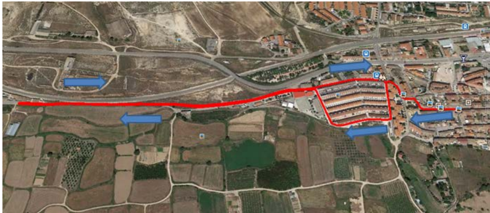
Recorrido primer segmento carrera a pie 5km (2 vueltas).

Primer segmento de carrera a pie: El recorrido de carrera a pie transcurre por zona urbana y alrededores. Saliendo desde la plaza del ayuntamiento (Plaza España). Dando dos vueltas a un circuito de 2,5km de distancia.