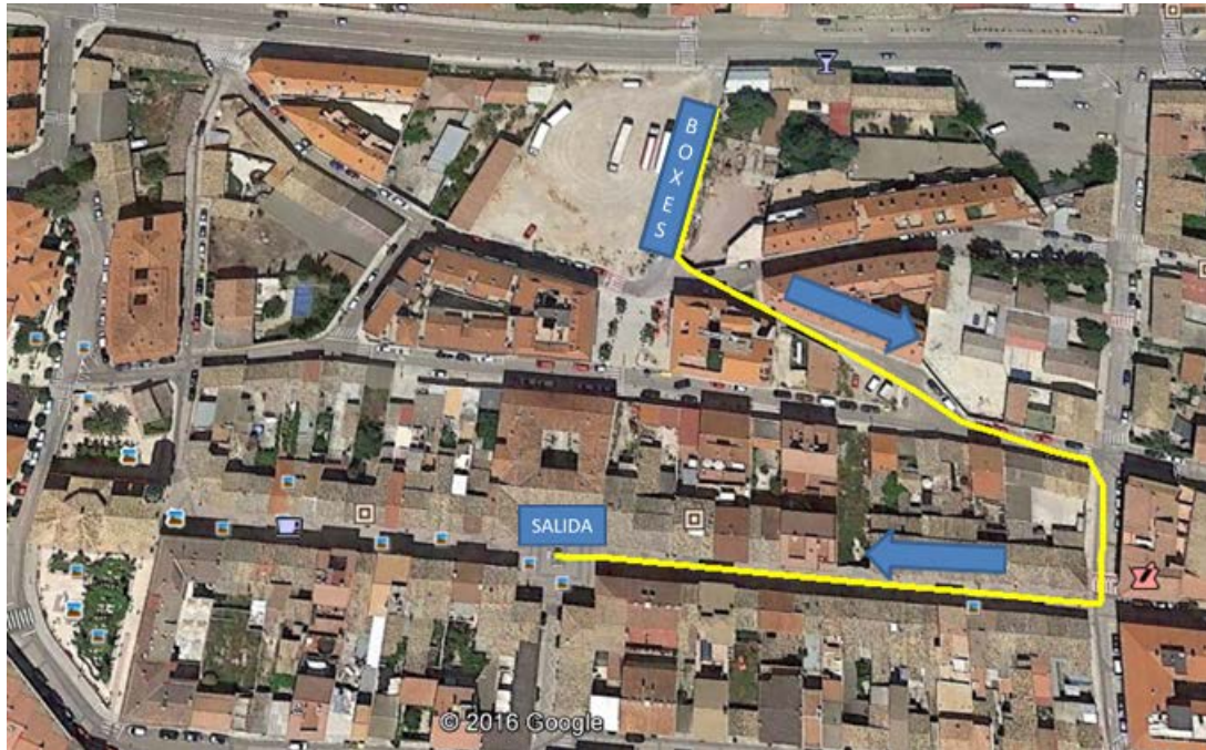
Detalle del enlace de la T2 al segundo segmento de carrera a pie.

Tras el paso a la altura de la salida se realizará una vuelta similar a las que se realizan en el primer sector de carrera a pie, con la diferencia de que el punto de giro de 180° se realizará 400m antes esta vez (ambos giros estarán bien indicados y con personal de la organización).